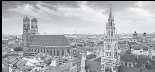
MUNICH | OCTOBER 15, 2021 / 980 EUR