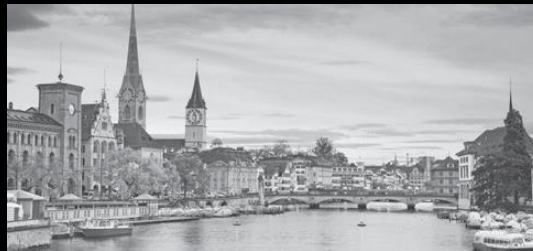
ZURICH | OCTOBER 22, 2021 / 980 CHF