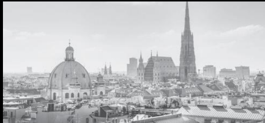
VIENNA | OCTOBER 21, 2021 / 980 EUR