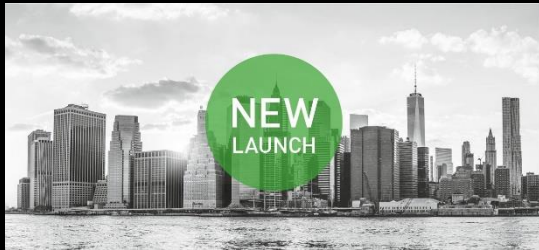
NEW YORK CITY | NOV 12, 2021 / 980 USD